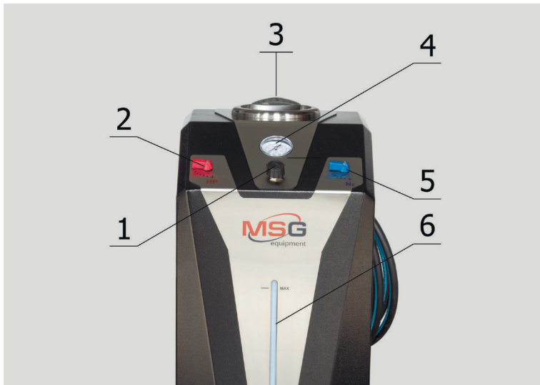
Рис. 2. MS101P – Описание элементов на передней части станции