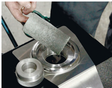
Рис. 6. Фильтрующий элемент после первого цикла промывки

Продувку азотом необходимо осуществлять до полного удаления промывочной жидкости из системы автокондиционирования.