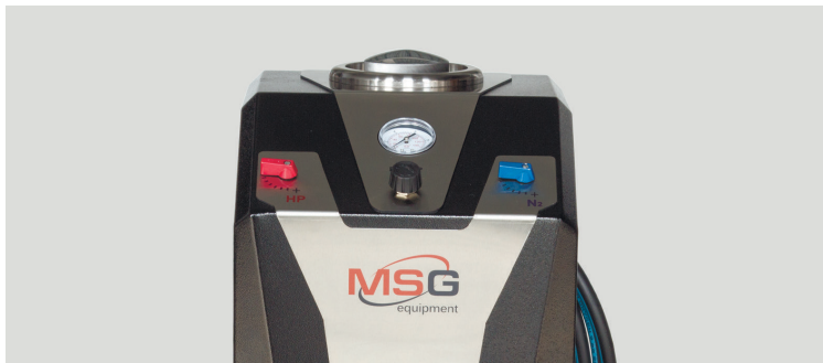
Рис. 1. MS101P