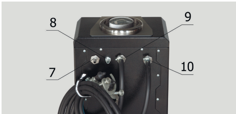
Рис. 3. MS101P – Описание элементов на задней части станции

⚠ ПРЕДУПРЕЖДЕНИЕ! В станцию не допускается попадание сжатого азота с давлением выше чем 10 бар.