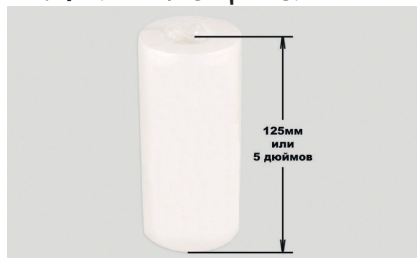
Рис. 4. Внешний вид фильтрующего элемента

В данной станции применяется полипропиленовый фильтрующий элемент для очистки воды. Полипропилен, из которого изготовлен фильтр, не взаимодействует с промывочными жидкостями, рекомендованными для применения.